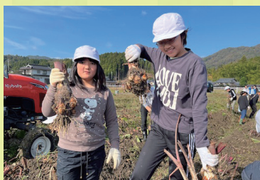
えびいもの収穫体験