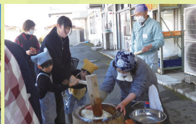
農ふれあい教室（餅つき）