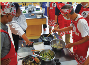
男性初心者料理教室「おじさまの腕まくり」