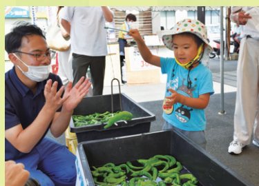
万願寺甘とうフェス

地域農産物の消費拡大に向けて、都市部の市場関係者に向けた販売促進活動を行うとともに、生産者部会と連携したイベントの開催や、当JAが開催している料理教室の素材に地元野菜を使用するなどの消費拡大運動に取り組んでいます。