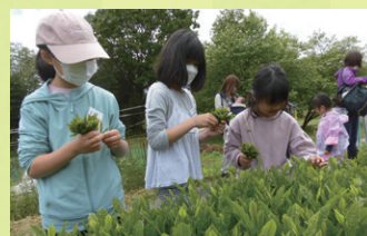
農ふれあい教室（お茶摘み）

地域の子どもたちが農業の魅力を感じてもらう場として、「農ふれあい教室」を開催しています。教室ではお茶や小豆の収穫体験や調理実習、餅つきなどを年4回開催しています。また、地域の生産者と連携して、小学校へのお出前授業や田植えや稲刈り、えびいもの収穫体験などを開催しています。