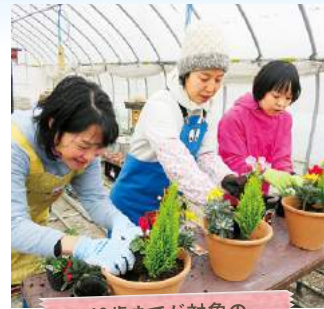
49歳までが対象の フレッシュミズ・カレッジ