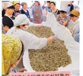
50歳から65歳までが対象の プラチナ・カレッジ

お問い合わせ先 近隣の JA 京都にのくに 各支店 または JA 京都にのくに 暮らしの活動推進課 TEL 0773-42-5566 FAX 0773-42-8606