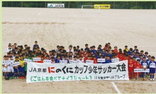
▲ 賞品はにのくに米! ごはんを食べてナイスシュート!