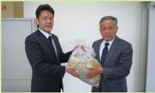
▲ 収集した使用済み切手を綾部・福知山・舞鶴市の社会福祉協議会に寄付