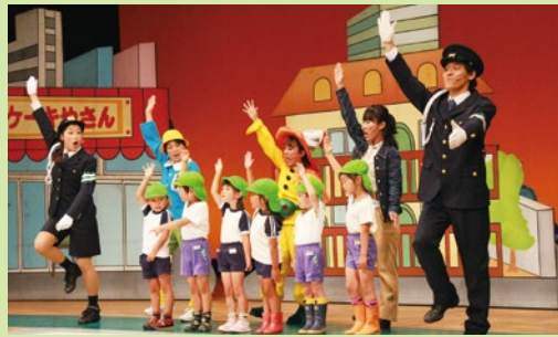
▲ 管内の園児を対象に参加型のミュージカルを開催