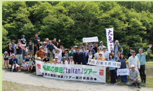
▲ 大江町毛原の棚田田植え体験会に参加

JA京都にのくにには、地域の皆様と一緒に地域に愛され、親しまれる、ふれあい重視の社会貢献活動を展開しています。