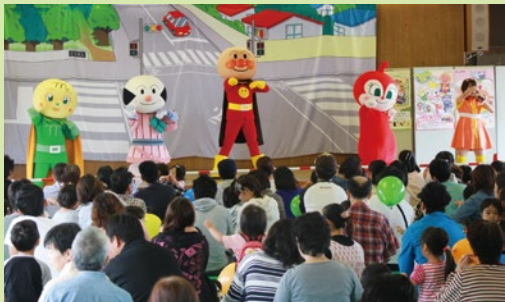
▲ アンパンマンと一緒に楽しく交通安全のお勉強