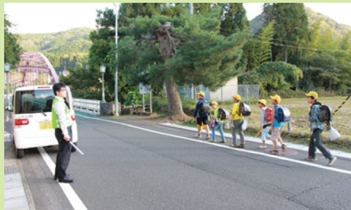
▲ 下校時の通学路や公共施設をパトロール