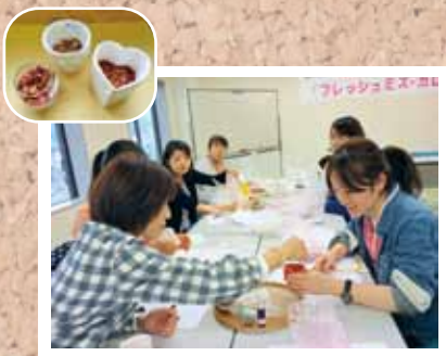
第6回 アロマポプリ・スプレー作り

JA京都にのくにには、管内の女性が教養を深め、生活の充実を目指し、文化、福祉、教育などを通じて、元気な地域づくりと、心豊かな地域の仲間づくりを行う事を目的として、JA京都にのくに女性大学「フレッシュミズ・カレッジ」を昨年より開校しています。 『フレッシュミズ・カレッジ』を通じて、次世代を担う地域の女性に幅広い学習の機会を提供する事で、JA組織の活性化に重要な若い女性リーダーの育成と、地域農業の振興やJAのファンづくりに取り組んでいます。