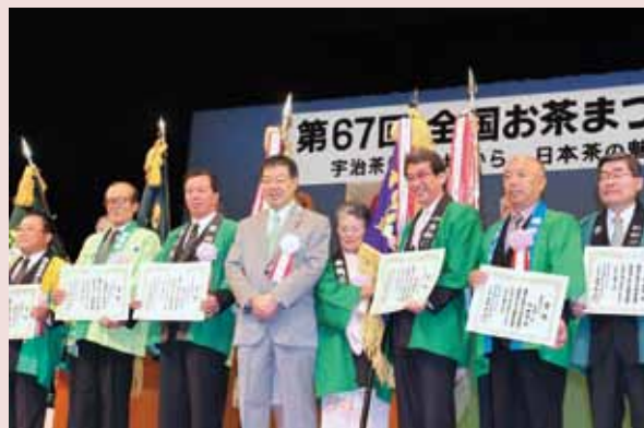
第67回全国お茶まつりにて「にのくに茶」が産地賞・農林水産大臣賞他多数受賞しました!!