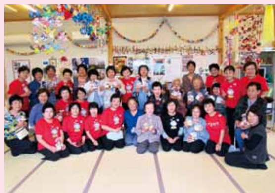
▲ 仮設住居者との交流