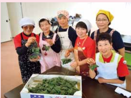
▲ JA新ふくしま女性部との女性部合同料理教室