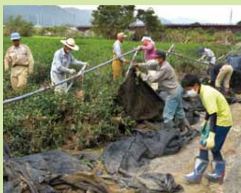
▲ 台風18号により被災された農家への災害復旧支援活動(10月8日～)