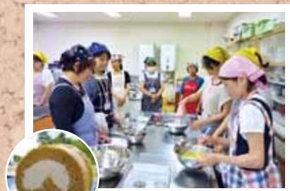
第2回 米粉を使ったお菓子作り