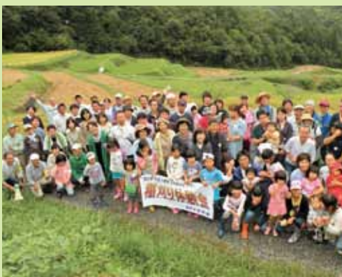
▲ 大江町毛原の棚田稲刈り体験会に参加 (9月8日)