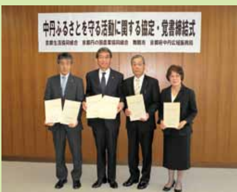
▲ 舞鶴市と高齢・独居者ら住民の安否を見守る活動に関する協定を締結(11月6日)