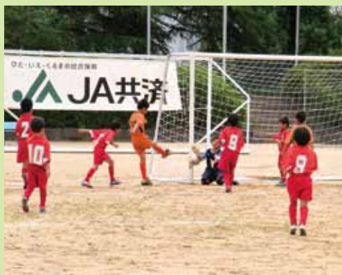
▲ 管内12チームによるサッカー大会 (7月6日)