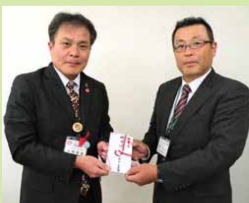
▲ 10月19日に開催した夢彦フェアでのバザー収益金を管内各市に寄付(11月8日)