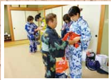
第3回 浴衣の着付け