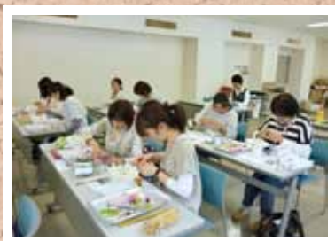
第1回 プリザーブドフラワー アレンジメント