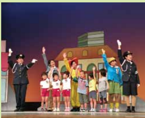
▲ 管内の親子を対象に交通安全ミュージカルを開催 (6月12日・13日)

「JA京都にのくにには、地域の皆様と一体となって地域に愛され、親しまれる、ふれあい重視の社会貢献活動を展開しています。」