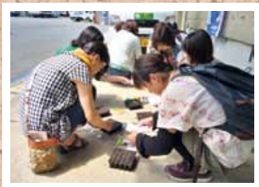
第4回 パンジーの種まき