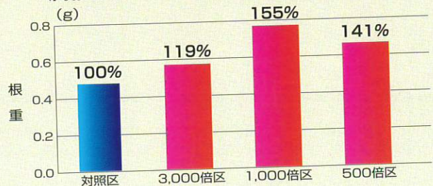
腐植酸による根量増加(トマト育苗)